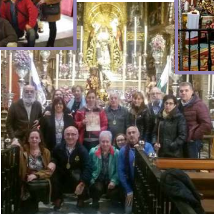
Foto de grupo, tras conseguir el jubileo extraordinario por el 750 aniversario fundacional de la Real Parroquia de Señora Santa Ana de Triana.