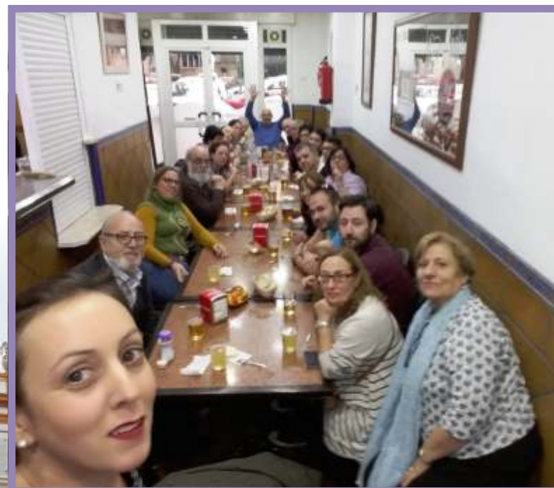
Reponiendo fuerzas en Sevilla una vez ganado el Jubileo.