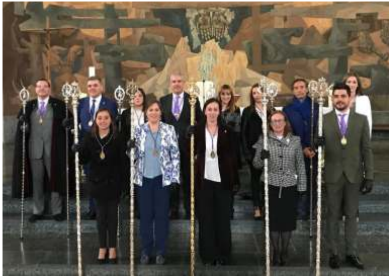
Junta Directiva de la RHJDO para el año 2017-2018.