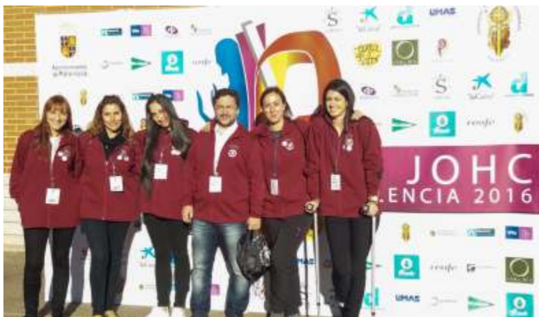
Participantes (jóvenes y no tan jóvenes) de la RHJDO en el IV Encuentro Nacional de Jóvenes Cofrades.

El IV Encuentro Nacional de Jóvenes Cofrades, IV JOHC, se celebró en Palencia el fin de semana del 28, 29 y 30 de Octubre, acogió a más de 700 personas interesadas en la Semana Santa Palentina, sobre todo jóvenes, que nos desplazamos allí desde toda España. Desde León nos