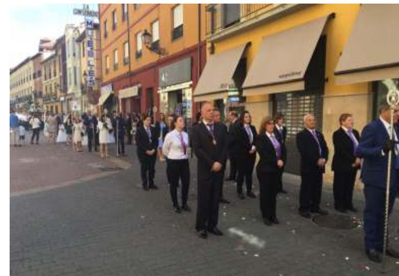
Hermanos de la RHJDO desfilando en la Procesión del Corpus Christi sin su imagen titular el pasado 18 de junio.