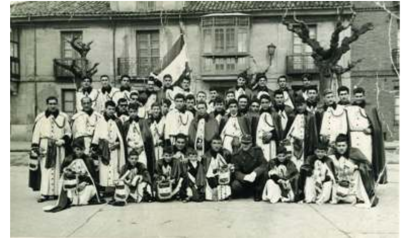
Imagen de la banda de Cornetas y Tambores del año 1965

Desde aquí queremos agradecer su dedicación durante este tiempo a los miembros de las dos secciones musicales, así como a todos aquellos que han pasado por las diferentes formaciones en estos casi 60 años.